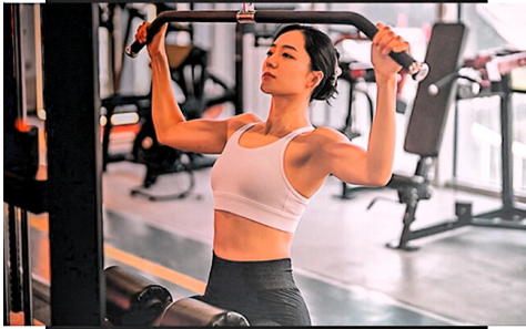
新手 X 健身指南

随着生活水平的提高 越来越多的人开始关注自己 的身体健康和身材管理 健身房作为锻炼身体的理想场所 受到了广大市民的青睐 但对于很多初次走进健身房的新手来说 往往会感到无所适从 本文将为新手提供一份详尽的有氧运动的指南 帮助大家实现自己的健身目标